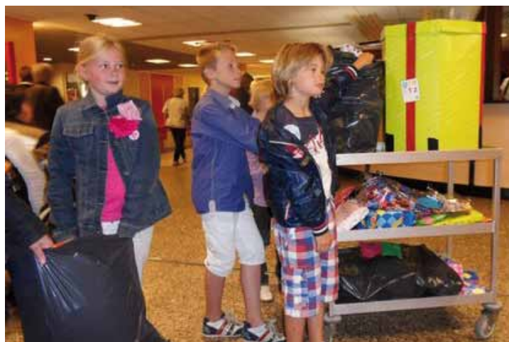
Foto rechts onder: Kinderen van Basisschool "De Bongerd", "De Esch" en de "Drieëenheidsschool" bij MST in Enschede.