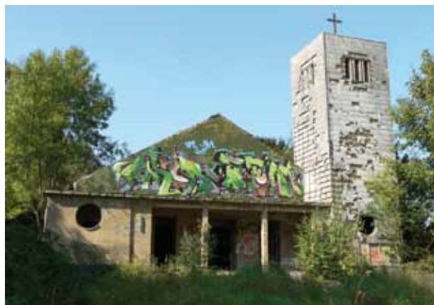
Exterieur van de verwaarloosde kerk van Camp Hitfeld in Aken.

voor het altaar staat en kijkt u heel goed naar de overledene. Daarna verlaat u de kerk door het zuiderportaal. Uiteindelijk zal ik de viering alleen afsluiten. Zouden sommigen wellicht van mening veranderen, dan vraag ik hen door het noorderportaal weer binnen te komen. In plaats van de uitvaartdienst zou ik namelijk in dit geval een dankviering willen houden.” De priester ging naar de kist en opende de deksel, en er kwam onmiddellijk een grote processie op gang. Allen wilden toch wel de dode kerk in de kist zien liggen, en de mensen waren ontzettend benieuwd naar het