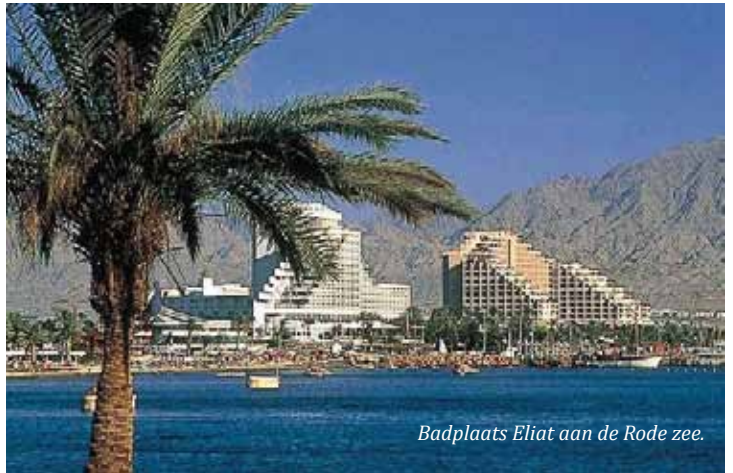
Badplaats Eilat aan de Rode zee.