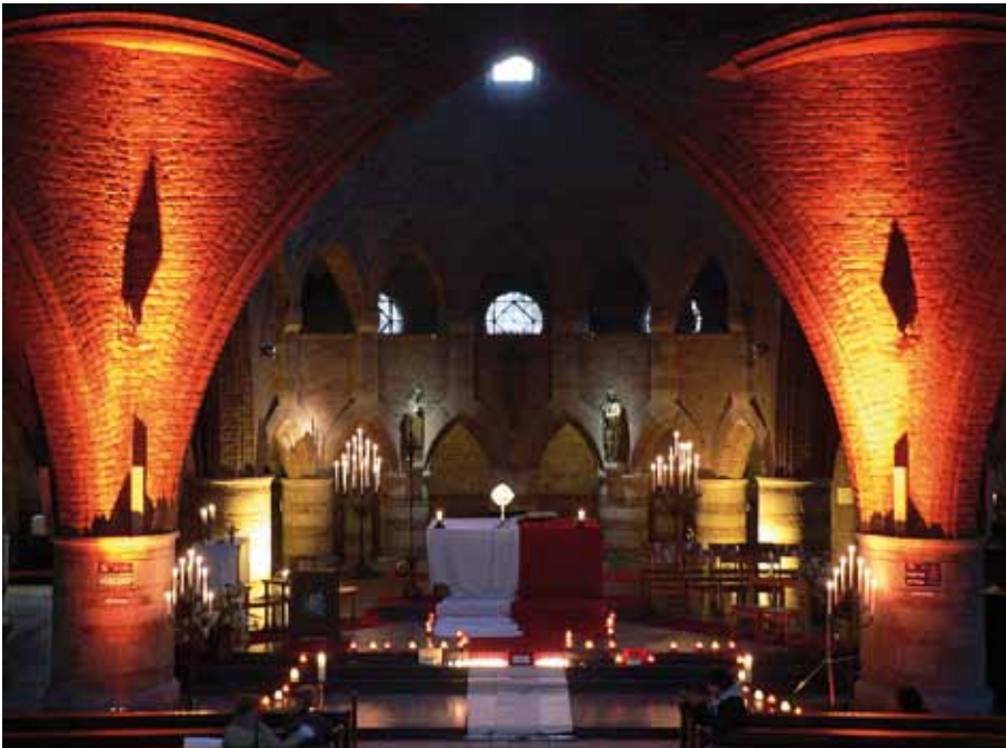
Een heel indrukwekkend gebouw voor "Nightfever" de kerk van St. Jacobus de Meerdere te Enschede