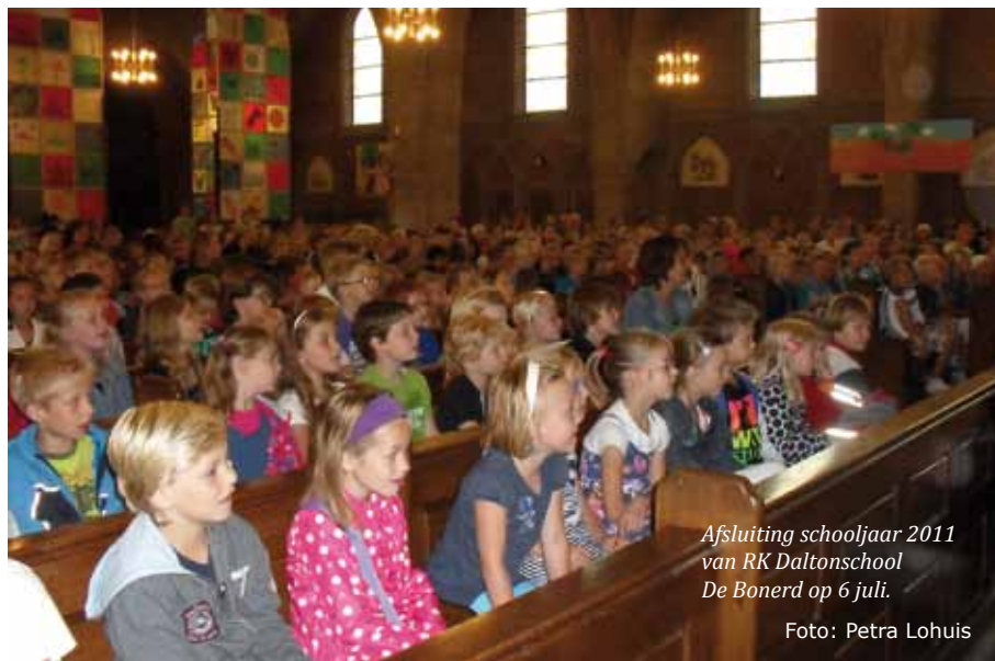
Afsluiting schooljaar 2011 van RK Daltonschool De Bongerd op 6 juli.

schooljaar op een leuke manier afgesloten met een gezamenlijke viering in de Drieëenheidkerk. De groepen 1 en 2 hebben dit in de hal van de school aan de Wieldraaierlaan gedaan.