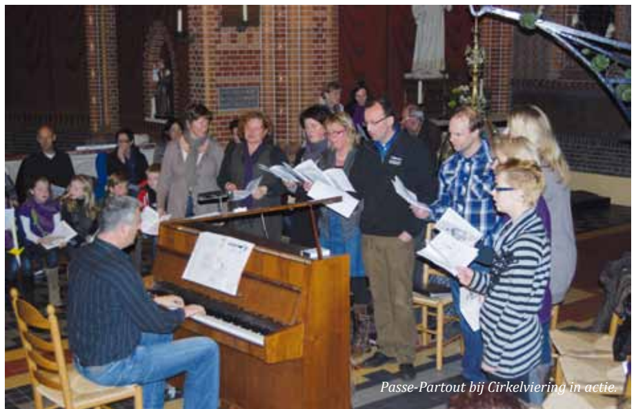
Passe-Partout bij Cirkelviering in actie.